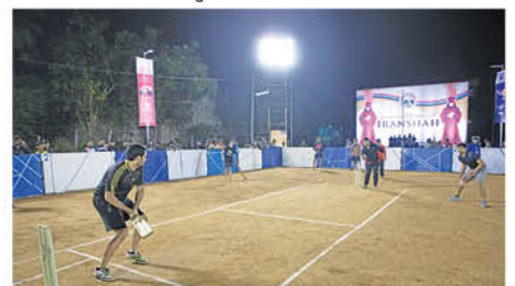
Winter Fest Games

I'm ever grateful to Dr. Cyrus Poonawalla for his faith in us and for his highly valued support in IUU. I'm also thankful to CM Rupani for gracing IUU 2019. I thank our Exclusive Media Partner - Parsi Times who have been with us since the start, and provided us with the publicity for this event. I also thank all our well-wishers and supporters including Team Wizcraft, Team IUU, the local gram Panchayat and its members,