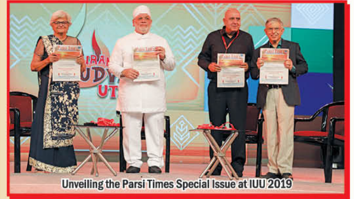
Unveiling the Parsi Times Special Issue at IUU 2019