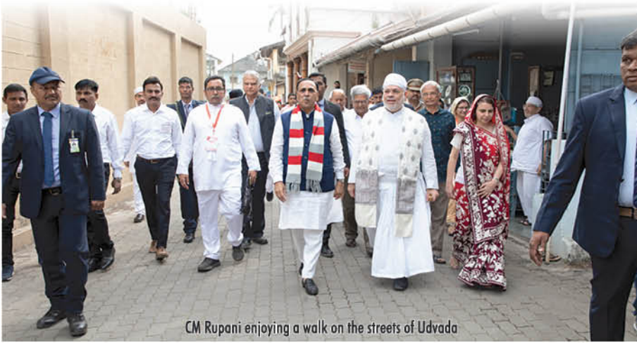
CM Rupani enjoying a walk on the streets of Udvada