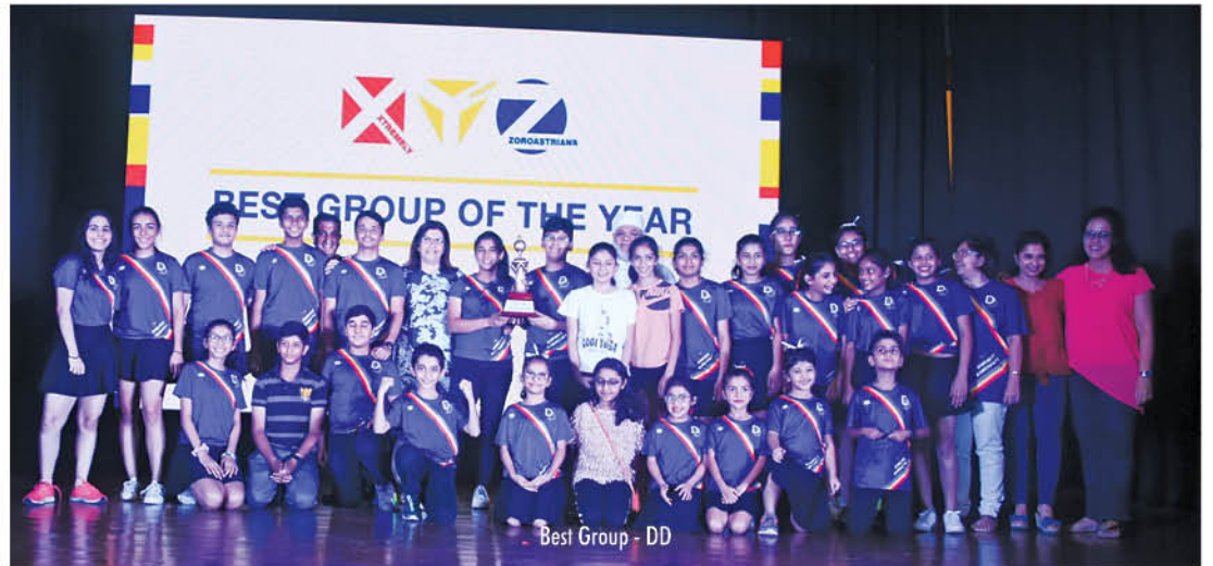
Best Group - DD

A new XYZ initiative - XYZ Seniors - was introduced, where the alumni of XYZ, ie. the youth of our community over 15 years of age, will plan and organise