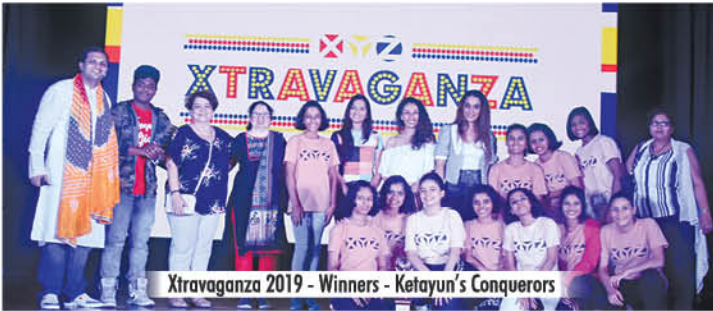
Xtravaganza 2019 - Winners - Ketayun's Conquerors

XYZ held its most looked forward to event - Xtravaganza - and its Annual Day on 21 st December, 2019, at KC College Auditorium, in Mumbai. The evening started with a Humbandagi by the Presidents of all eight groups for 2019. With 'Human Emotions' marking the theme for Xtravaganza 2019, each group was assigned an emotion to be portrayed through dance.