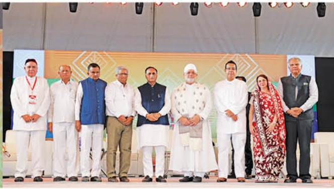
Dignitaries on Stage