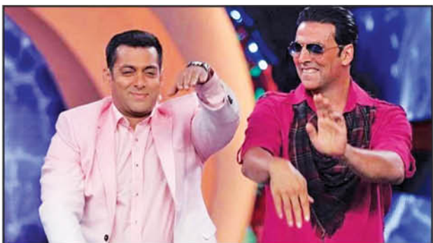
Calling all our readers to caption this picture! The wittiest caption will win a fabulous prize!

Send in your captions at editor@parsi-times.com by 8th January, 2020.