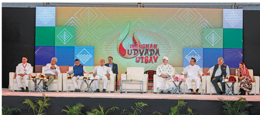
Dignitaries on Stage

The first day started auspiciously amidst much excitement with opening prayers held at the Iranshah Atash Behram for a Hama Anjuman Maachi and Jashan at 3:40 pm. The IJU Winter Fest - Sport Matches also began at the Winter Fest Grounds, in Udvada village, which felt like it had come alive amidst the great exuberance of positivity and liveliness!