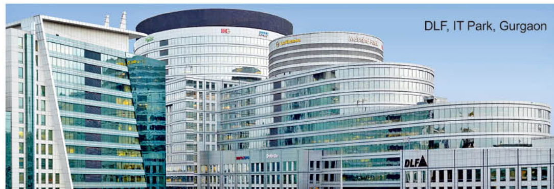
DLF, IT Park, Gurgaon

Please note : We have no branches or outlets