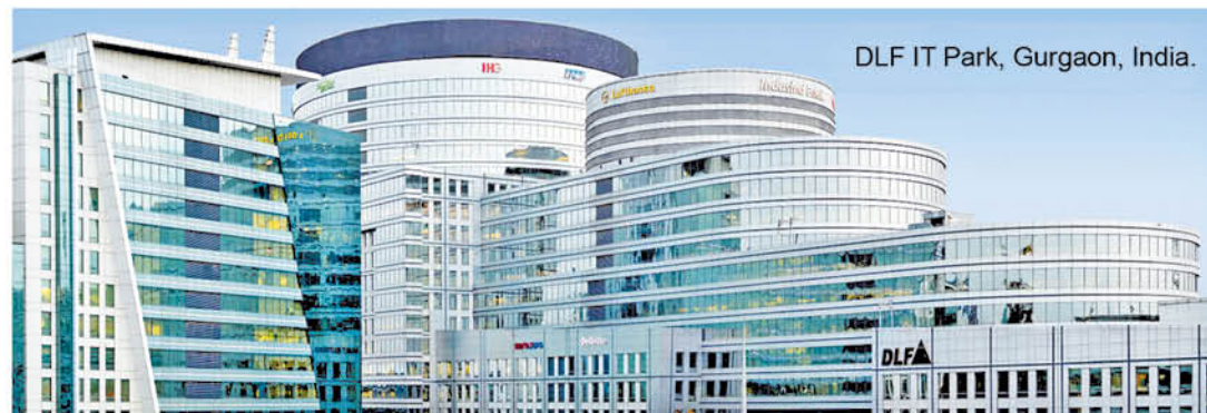
DLF IT Park, Gurgaon, India.

• 154 years in business • 70,000+ global workforce • Presence in 70 countries