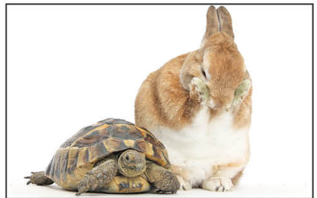
Calling all our readers to caption this picture! Send in your captions at editor@parsi-times.com by 28th April, 2021 Winning Caption and Winner's Name Will Be Published Next Week.

Disclaimer: Some of our 'Caption This' Contest photos are taken from freely available, public online resources and are published in a light and humorous vein, which is the mainstay of the Parsi spirit! No offence is intended to anyone or any situation.