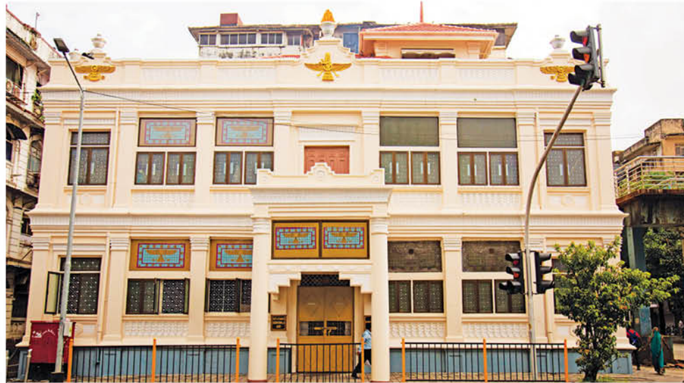
Sodawaterwalla Agiary Renovated To Its Former Glory

The J D Amaria (Sodawaterwalla) Agiary, at Marine Lines in Mumbai, was in need of urgent repairs and restoration for a while. Plants were seen growing from the walls, causing big cracks. Heavy leakage had corroded the beams and windows were broken. The interiors were gloomy with peeling paint, plaster fallings at places and columns with cracks. A few years ago, the Trustees put out an appeal for funds to renovate the Agiary, but the response was insufficient to undertake any major repair.