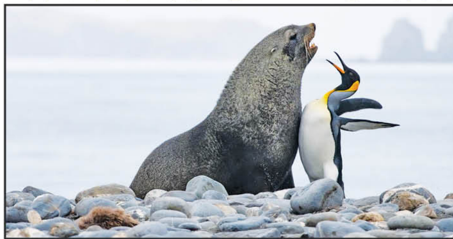
Sea Lion: I am a lion! I am KING! Penguin: Bah! I am EMPEROR! Emperor Penguin!!