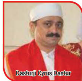
Dasturji Cyrus Dastur