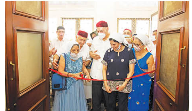
Cutting The Ribbon