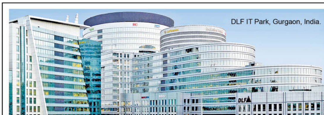
DLF IT Park, Gurgaon, India.

• 154 years in business • 70,000+ global workforce • Presence in 70 countries