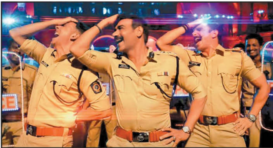
"No more lockdown please...paachhu vaasan dhova parse!!!"