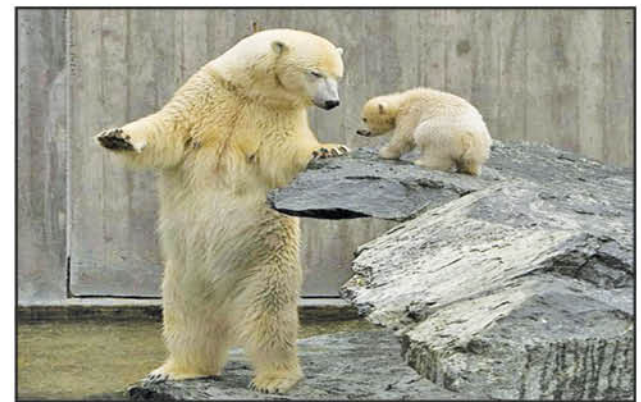
Calling all our readers to caption this picture!

Send in your captions at editor@parsi-times.com by 22nd December, 2021