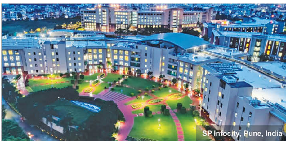
SP Infocity, Pune, India

Line-up - poems and stories of love, friendship, romance and hope, to warm your heart on a winter evening on Saturday, 18 th December at 4.00 pm at the Experimental Theatre and Ballet Screening of the Nutcracker , which tells the story of Marie and her whirlwind adventure with Tchaikovsky's score Op. 71 delighting the ears and hearts of music lovers, on Tuesday, 28 th December at 6.00 pm at the Godrej Dance Theatre. For detailed information, call NCPA: +91 22 66223754 / 66223724 or visit: www.ncpamumbai.com