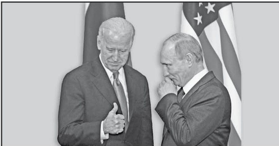
Biden: You're left with a big 'Thenga' - our sanctions have been a major stinger! Putin: Put you thumb away - my answer to you lies in a different finger!!