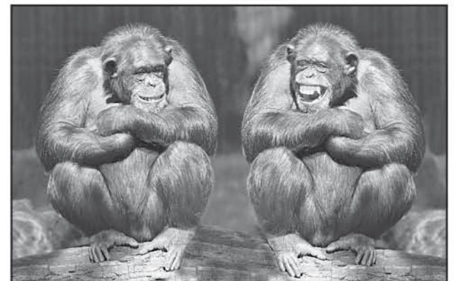
Calling all our readers to caption this picture!

Send in your captions at editor@parsi-times.com by 13th April, 2022