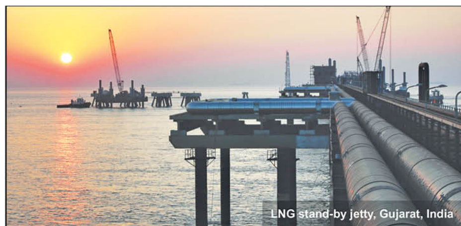
LNG stand-by jetty, Gujarat, India

NATO officials recently released an estimate of Russian military deaths in the Ukraine war - up to 15,000. Officials believe the toll to be much higher. An emergency meeting of NATO leaders is called in Brussels. The NATO chief also called on the allies to step up defense of other potentially threatened countries. The war in Ukraine has resulted in NATO