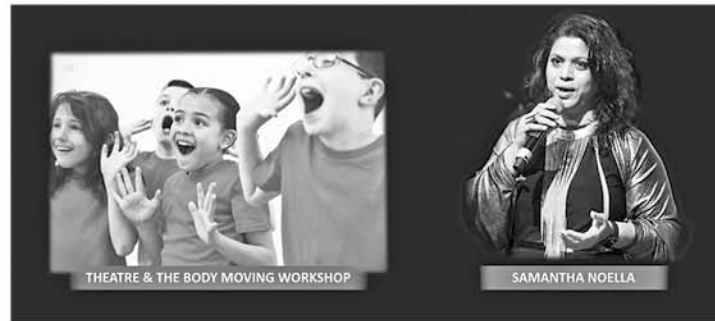
THEATRE & THE BODY MOVING WORKSHOP